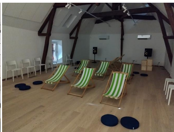
Des Vies courantes , Anne-Line Drocourt (vues de l'exposition)