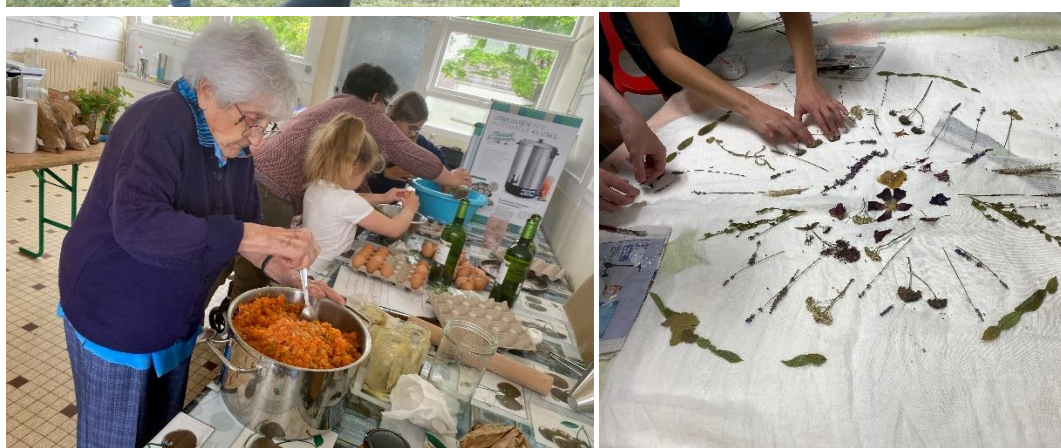
Résidence Alambic (2020-2022)