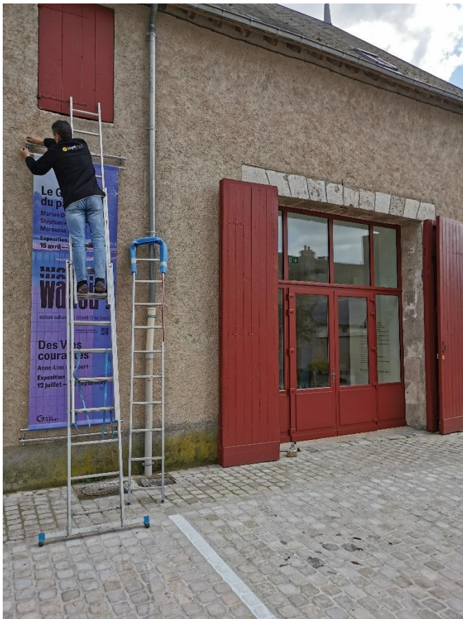
Le Pressoir, vue extérieure